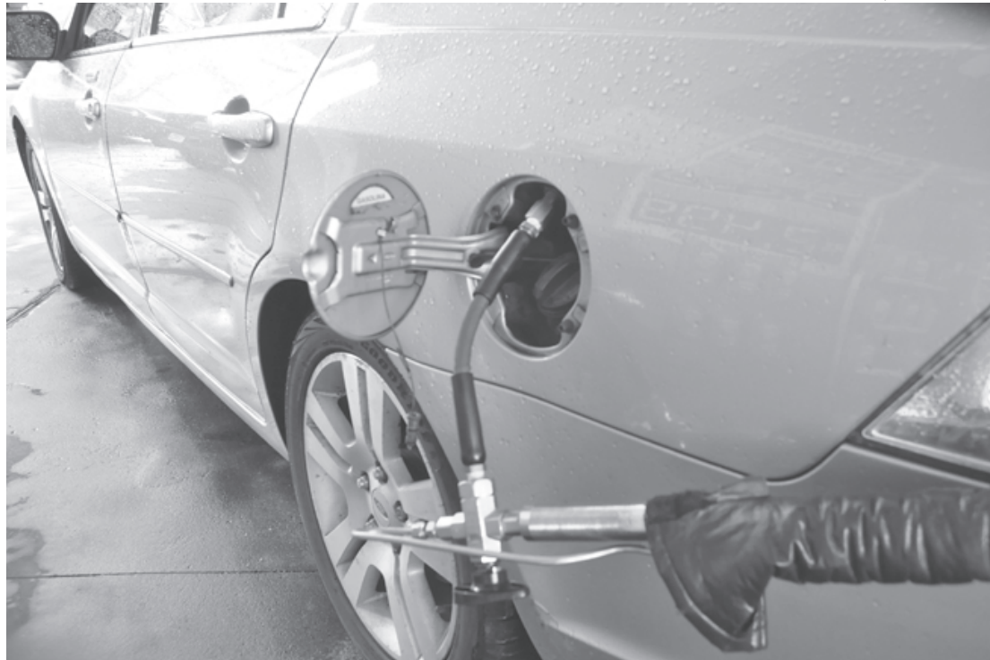
Segundo a Petrobras, o preço final do gás natural ao consumidor não é determinado apenas pelo preço de venda