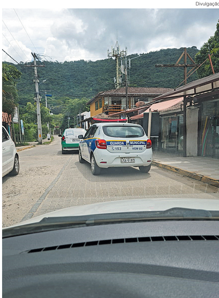
Prefeitura fez o flagrante decorrente de denúncias anônimas

O comerciante foi multado em R$ 15 mil, porque abriu o quiosque mesmo estando proibido, mais R$ 5 mil, por cada um dos 16 frequentadores que estavam no estabelecimento, no momento da fiscalização por parte da secretaria de Segurança e Ordem Pública.