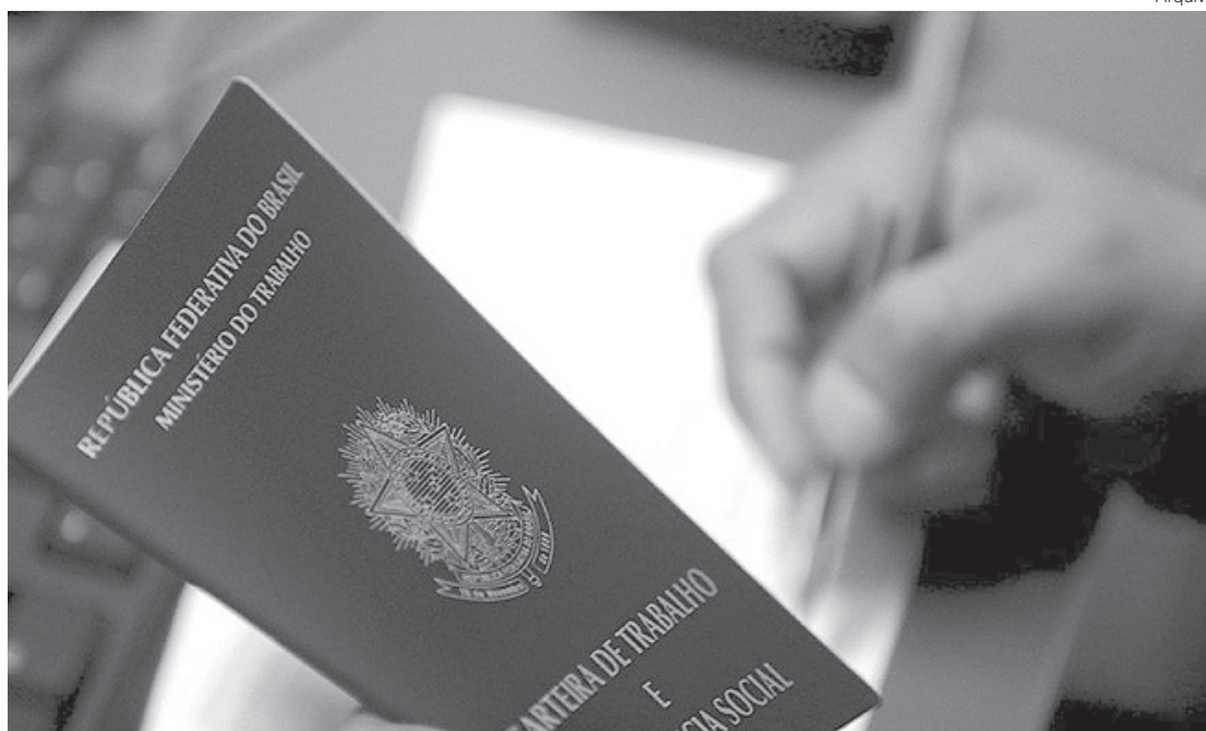
Vagas abertas são para setores como saúde, alimentação, informática e serviços gerais