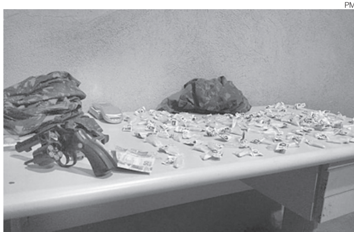
Material apreendido foi entregue na 93ª DP

Segundo a PM, os agentes faziam patrulhamento na Rua 31 e, em certo momento, tentaram abordar um jovem, suspeito de tráfico. Durante tentativa de abordagem, o jovem e o suposto comparsa fugiram.