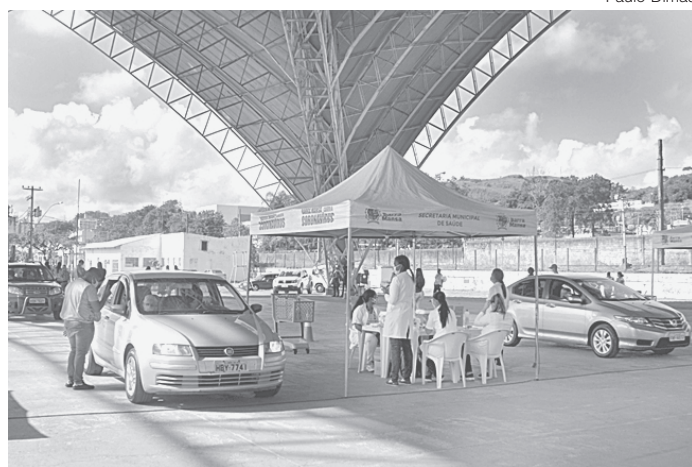
Em sistema drive thru, no Parque da Cidade, a dose complementar alcançou 568 pessoas

Nesta segunda-feira (5) foi realizada a aplicação da segunda dose da vacina contra a Covid-19 em idosos de 78 anos de idade. Em sistema drive thru, no Parque da Cidade, a dose complementar alcançou 568 pessoas. Porém, o quantitativo de imunizados no Parque da Cidade foi maior, já que houve a aplicação da primeira dose em 22 idosos de 66 anos, de duas doses em profissionais de saúde com faixa etária de 25 anos e outras 20 doses, em Guardas Municipais.